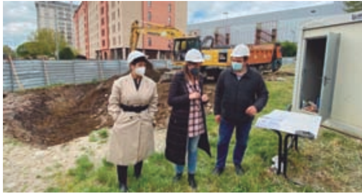
Visita ás obras do centro social de Lamas de Prado

O centro destinarase a realizar distintas funcións: asesoramento e axudas sociais, formación e cursos, así