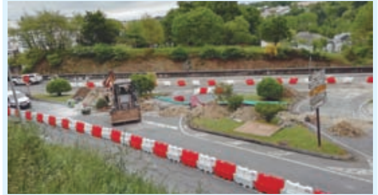
Unha vista das obras da nova rotonda