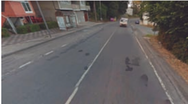
Unha imaxe da estrada ao seu paso por Guntín

"É unha demanda que podemos xa considerar histórica, que nin PP nin PSOE e Podemos están a levar adiante cando teñen responsabilidades de goberno" lembrou Néstor Rego. "A estrada atópase cun firme