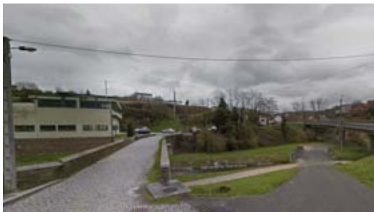
A ponte Vella do Rato