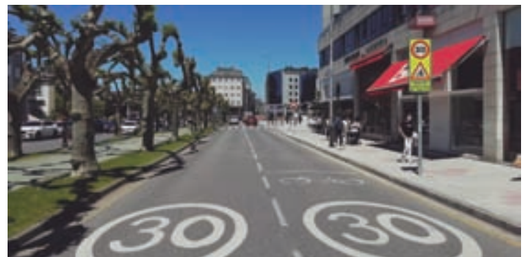
A avenida Ramón Ferreiro coa nova sinalización a 30

“Un proxecto que se atopa en fase de execución dende o mes de xaneiro e co que pretendemos unir oito