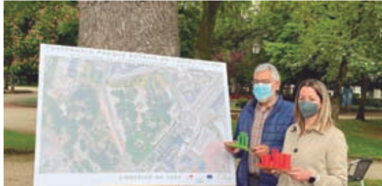
Presentación do proxecto de mellora do parque Rosalía

A estas actuacións súmanse as xa realizadas como a mellora e ampliación do parque infantil. As actuacións desenvolveranse de maneira conxunta entre a área de Medio Ambiente e a estratexia DUSI Muramiñae, ao incluír entre os seus obxectivos a posta en valor do patrimonio municipal, entre o que se atopa o parque Rosalía de Castro, catalogado BIC (Ben de Interese Cultural). Se está a traballar na conmemora-