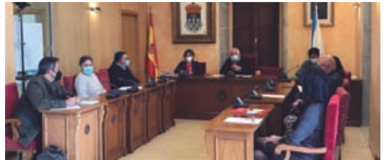
Unha vista do Pleno

OUTROS ASUNTOS DO PLENO. No Pleno tamén foi aprobada a ordenanza municipal reguladora do uso de zoas verdes e áreas recreativas do Concello de Outeiro de Rei. O debate comezou coa mención da