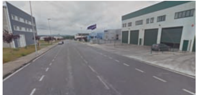
Polígono empresarial do Corgo

O voceiro argumentou ademais que a Agrupación Socialista do Corgo propuxo en distintas ocasións a través de varias iniciativas, axudas económicas para tódolos afectados, “e sempre vamos a seguir defendendo propostas nese sentido, co fin de que contribúan a dinamizar o tecido