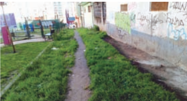
A rúa Xardín, no barrio da Milagrosa

A Asociación de Veciños, Comerciantes e Industriais Distrito da Milagrosa está recibindo múltiples queixas por parte dos veciños sobre o lamentable estado no que se atopa a rúa Xardín, que está situada entre a rúa Serra de Ancares e a rúa Río Éo. Trátase dunha zona moi transitada ó estar situada preto dun organismo oficial (Sección de Cualificación y Valoración de Discapacidades – Xunta de Galicia), de zonas de aparcadoiros