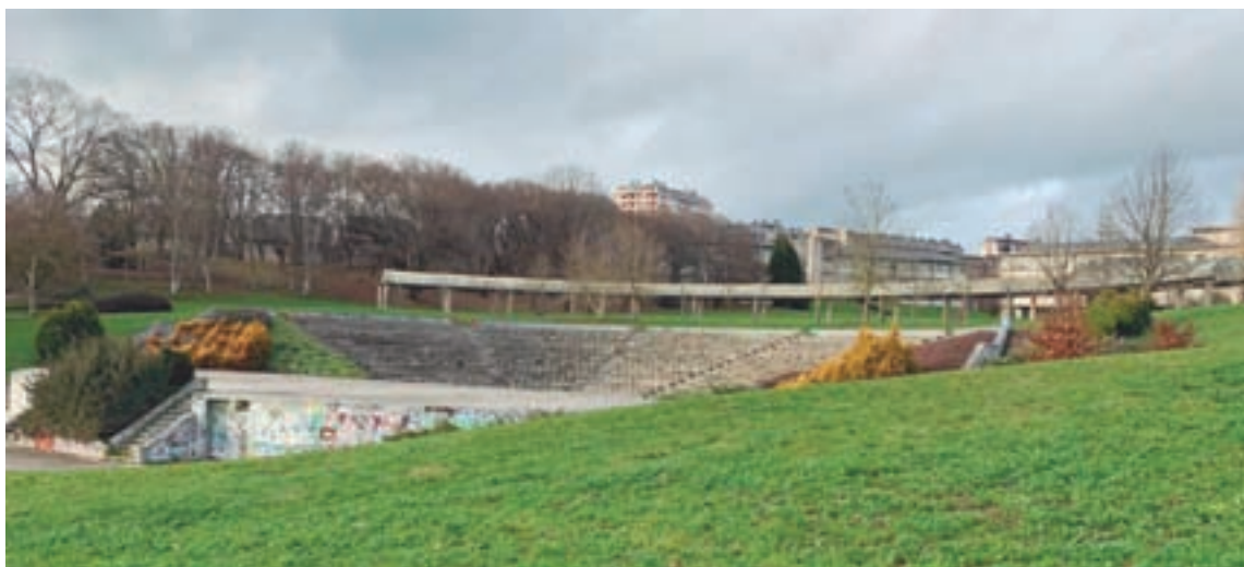
O anfiteatro no val do campus

O Concello tivo que afrontar varias veces cambios nos proxectos desenvolvidos para a execución da praia fluvial, incluso nas zonas de ubicación elixidas, para poder obter todos os permisos necesarios das distintas administracións implicadas. O último dos mesmos chegou a finais do 2020.