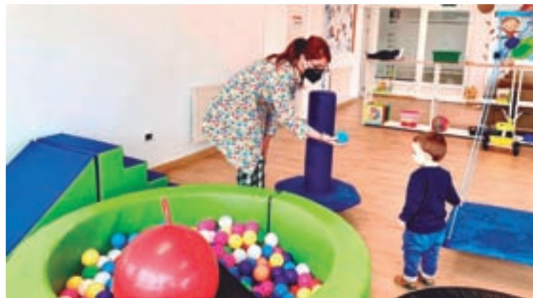
O centro de atención temperá de Friol

En estes momentos o servizo está atendendo a uns 46 nenos e nenas con algún tipo de necesidade, para favorecer o seu desenvolvemento psicomotor, cognitivo, de linguaxe, comunicación, auto-