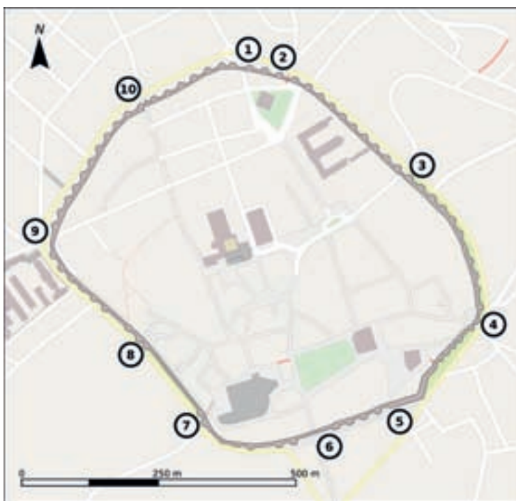
1. Porta de San Fernando, 2. Porta Falsa, 3. Porta da Estación, 4. Porta de San Pedro, 5. Porta do bispo Izquierdo, 6. Porta do bispo Aguirre, 7. Porta de Santiago, 8. Porta Miñá, 9. Porta do bispo Odoario e 10. Porta Nova

PORTA NOVA. Existente en época romana, era a saída da cidade cara a Brigantium ou Betanzos. Ata a construción da Porta de San Fernando foi a principal vía de comunicación da parte norte da cidade. A porta actual data do ano 1900, dado que a anterior estaba en estado ruinoso e ameazaba a seguridade dos viandantes. Para a construción desta porta nova houbo que derrubar un cubo da muralla.