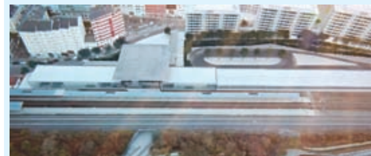
Unha infografía da futura intermodal

O 4 de agosto de 2010, Fomento, o Concello e a Xunta asinaron un acordo para a construción da nova estación intermodal que integrará tren e autobús e que se situará no emprazamento da actual estación de tren. A obra abrirá as portas á chegada do AVE á cidade.