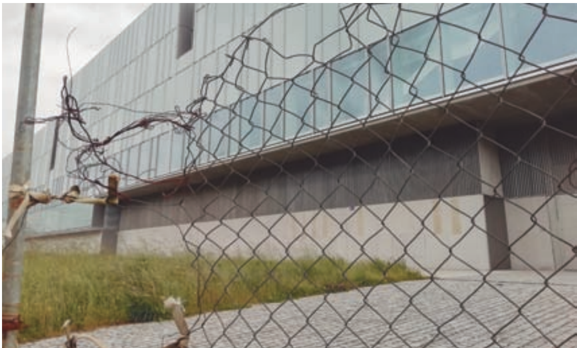
Imaxe do auditorio de Lugo

A avenida Ramón Ferreiro tivo un intento de ofrecer unha alternativa saudable e que axudaría a acougar o tráfico do centro. Foi no mandato do alcalde Joaquín García Díez, en 1995, cando se instalaron os primeiros carrís bici. Primeiro na Rolda de Fingoi (que aínda existe) e logo estendeuse por Pintor Corredoira, Armando