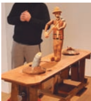
A mostra de Kinetiko