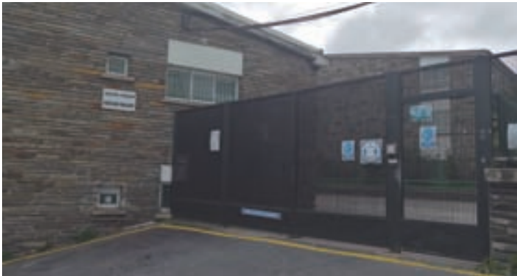
O novo centro de saúde podería ir nas instalacións vellas do colexio