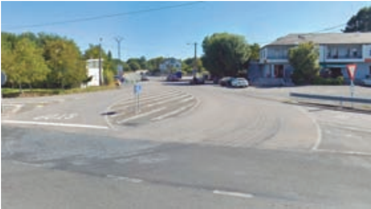
Imaxe do lugar onde se fará a rotonda

A Demarcación de Estradas do Estado en Galicia vén de someter a información pública o levantamento de actas previas para a ocupación de terreos co fin de construír unha glorieta na Nacional-VI, en Outeiro de Rei, prevista no quilómetro 513,670 da Nacional-VI e que teñen un orzamento de 365.472 euros.