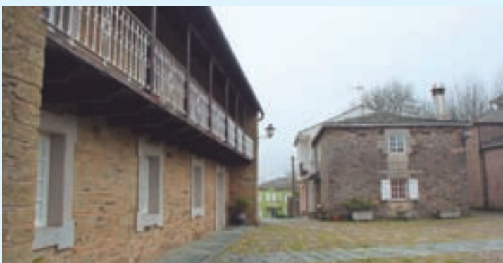
Unha vista da zona de protección de Castro de Rei

O Concello de Castro de Rei solicitou á Dirección Xeral do Territorio e Urbanismo unha axuda económica para acometer a redacción do Plan Especial de Protección do Conxunto Histórico de Castro de Rei por vía de convenio ou similar.