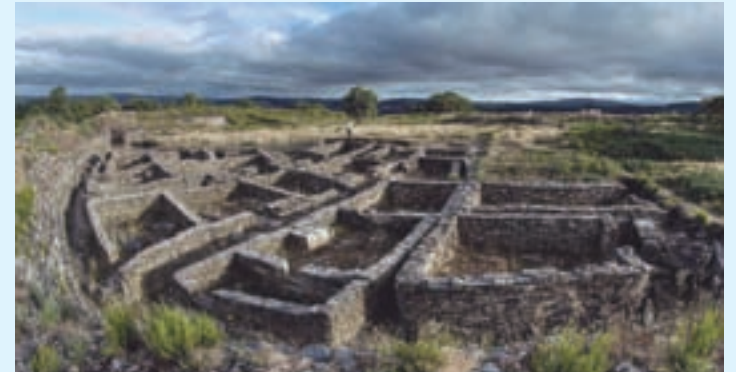
Castromaior, un dos maiores castros de Galicia

O Ministerio de Transportes, Mobilidade e Axenda Urbana está a executar no municipio, cun investimento de case medio millón de euros dous proxectos, incluídos no programa de intervencións de interese cultural no Camiño Francés, e que se prevén rematar antes do verán.