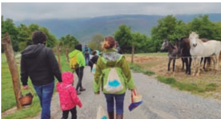
A primeira actividade foi un curso de iniciación aos cogomelos

Tamén aprobou a proposta do Goberno provincial para adherirse á Rede de Gobernos Locais pola Biodiversidade, unha sección da FEMP que aglutina pobos comprometidos co desenvolvemento sostible e a protección da diversidade de especies nos diferentes ecosistemas. A actividade da rede está dirixida ao impulso de políticas de conservación e incremento dos recursos naturais, á mellora do medio hídrico e da conectividade ecolóxica. Finalmente, sacou adiante unha modificación de crédito para ampliar con remanentes o Orzamento en case 4,2M€. Esa cantidade poderá destinarse á cooperación cos concellos, a entidades sen ánimo de lucro ou ao tecido empresarial.