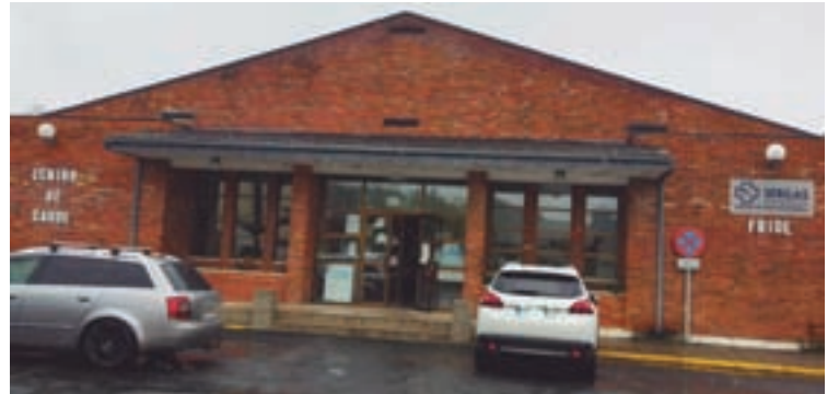
Exterior do centro de saúde de Friol

Unha das actuacións que se levarán a cabo será a substitución da carpintería exterior de aluminio. Tamén se realizará un retranqueo do tabique curvo de vidro tipo pavés para mellorar o acceso á consulta de pediatría e ampliar a sala de espera. Farase unha reparación de revestimentos vinílicos e tamén da pintura en zonas deterioradas. E por último,