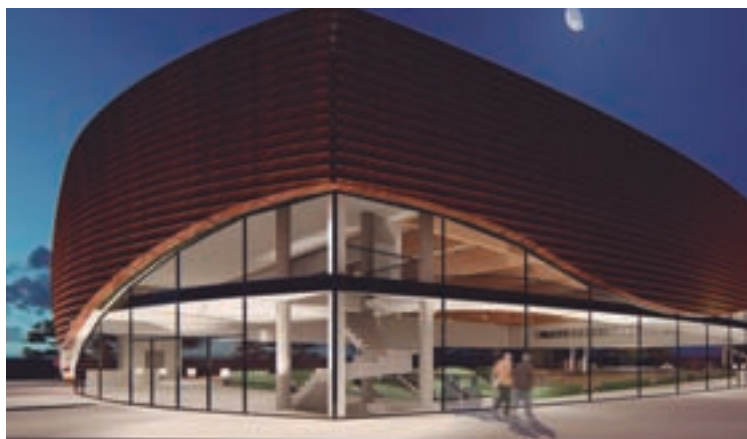
O proxecto das caldas, a Ronda da Muralla e o novo pavillón de Lugo

sar as actividades a desenvolver na contorna fluvial, senón que a cidade gañe un novo recurso cultural, de recreo e turístico.