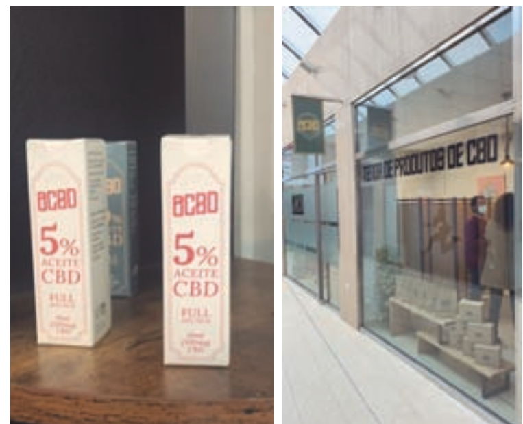
Arriba, o local e, abaixo, unha mostra do produto e o exterior da tenda