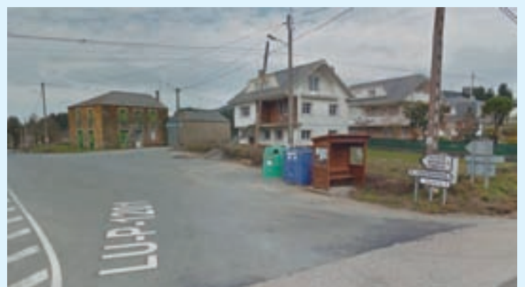
A vía na que se realizarán as obras

Os traballos que mellorarán 1,5 quilómetros, entre os núcleos de Coto -no Corgo- e de Agustín -en Castroverde-, consistirán no movemento de terras, a drenaxe transversal mediante a reposición das cunetas con tubos de formigón, a pavimentación con aglomerado en quente, e a sinalización horizontal e vertical, así como o balizamento e a limpeza de cunetas. O mandatario provincial sinalou que “con estas actuacións resolvemos un problema que se arrastraba dende