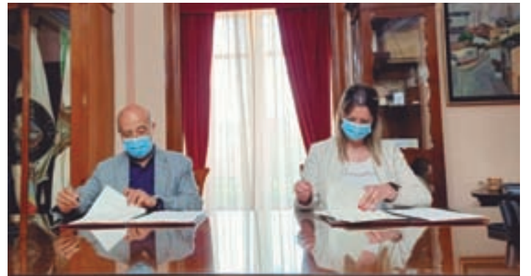
Firma do convenio entre ambas as dúas entidades

As actuacións que recolle abranguen a redacción dun proxecto que permita mellorar a capacidade de desaugadoiro do tramo fluvial canalizado nese enclave concreto, intervindo sobre a sección canalizada do treito sito augas arriba do caixón de formigón que discorre soterrado, para aumentar a súa capacidade o que obriga a modificar a xeometría actualmente existente.