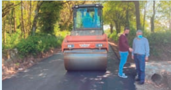
Supervisión das obras en Piñeiro

O Concello realizou a rexeneración do firme da estrada que vai dende A Silva, na parroquia de San Xoán do Campo, e que discorre a través da parroquia de San Martiño de Piñeiro, chegando ao límite do termo municipal de Guntín, por un importe total de adjudicación que ascende a 109.145,60 euros.