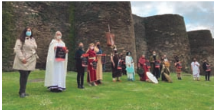
Imaxe da presentación das actividades

Este ano, no ciclo de cine arqueolóxico que xa comezou e que terá lugar no Vello Cárcere, proxectarase o Tutankamon, el tesoro redescubier-