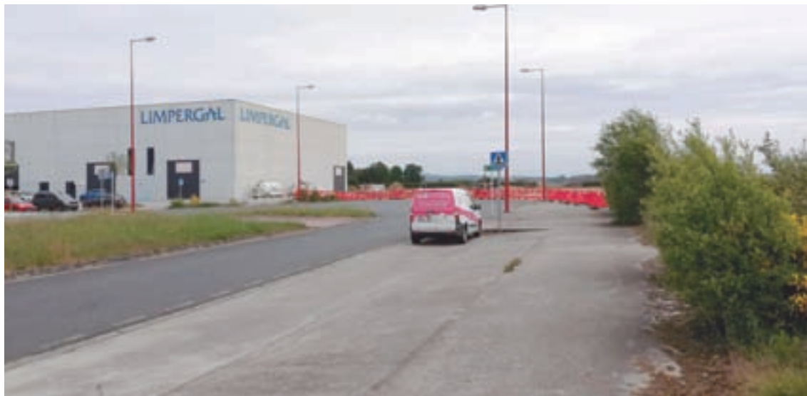
Xa comezaron os traballos de ampliación do polígono das Gándaras

O edificio Impulso Verde formará parte do Barrio Multiecolóxico do LIFE Lugo + Biodinámico, un proxecto que se desenvolverá