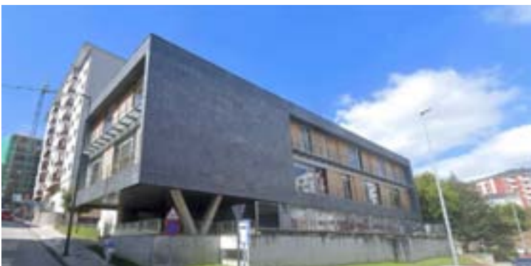
Centro social Maruja Mallo

A partir deste próximo fin de semana, os centros cívicos da cidade volverán abrir ao público, recuperando así o seu papel como espazos públicos de socialización.