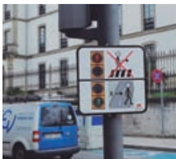
Cartel na rúa Ángel López Pérez

En total, instalaranse preto de 300 placas homologadas, que amosarán como funciona o semáforo dun paso de peóns e cando se pode cruzar ou non. As placas incorporan imaxes cedidas, de maneira altruísta, por