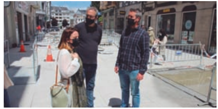
Concelleiros nacionalistas, visitando as obras

O proxecto dispón cun orzamento de 123.757 € e un prazo de execución de 6 meses