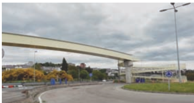
De arriba a abaixo, o paso inferior da N-VI, o edificio Impulso Verde da Garaballa e a nova pasarela sobre a N-VI