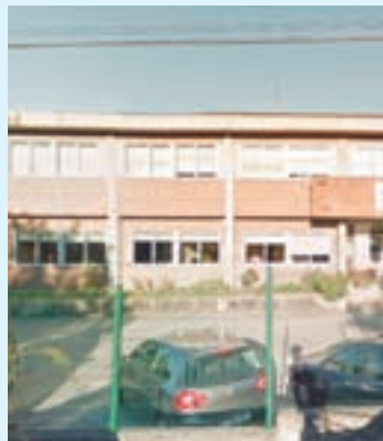
CPI de Castroverde

Están en licitación das obras de reforma que acometerá no CPI de Castroverde, cun orzamento de 322.400 euros. O proxecto presentouse hoxe e está adaptado ás novas esixencias construtivas establecidas no Plan de Nova Arquitectura Pedagóxica de Galicia, dotado con 191 millóns de euros. As empresas interesadas poden presentar as súas ofertas ata o día 28 de maio e as obras teñen un prazo de execución de dous meses. A previsión é poder telas en marcha no verán.