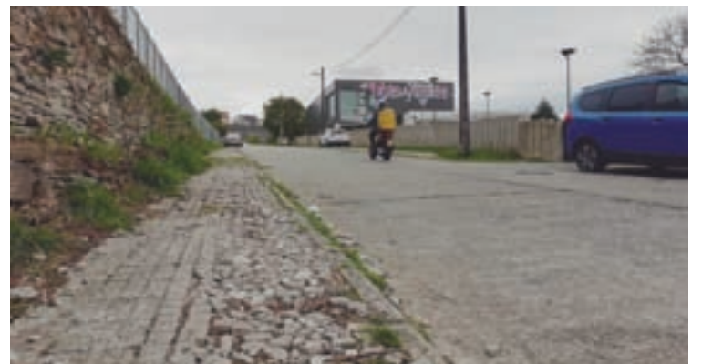
A rúa Xesús Bal e Gai de Lugo

“Así mesmo, denunciamos en numerosas ocasións a falta de seguridade que supón o tapón urbanis-