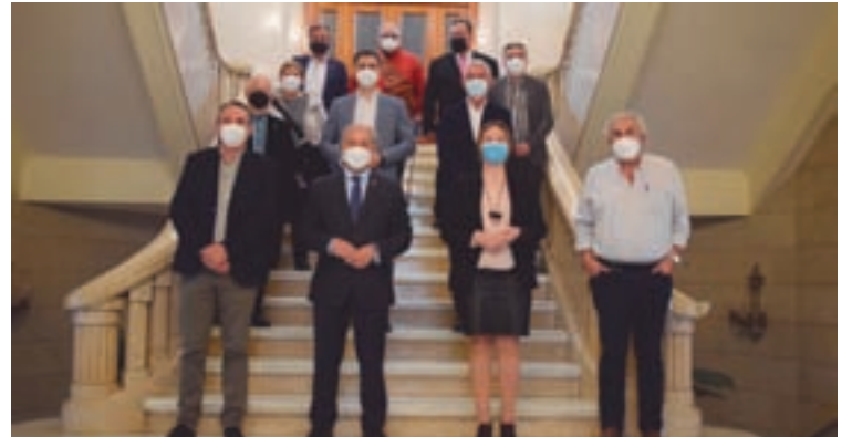
Recepción aos membros de CoGaVe na Deputación

No transcurso de dita asemblea, debatíronse temas de actualidade, tales como o IVE do recibo da luz, okupas, sanitarios, cobertura telefo-