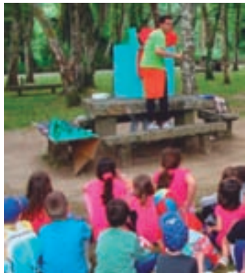
Unha imaxe do último campamento

O prazo para anotarse permanecerá aberto ata o 31 de maio ou ata cubrir prazas. Pode reservarse a estada nas oficinas municipais da Casa da Cultura de 10 a 14.30 horas ou chamando ao 982 39 34 08.