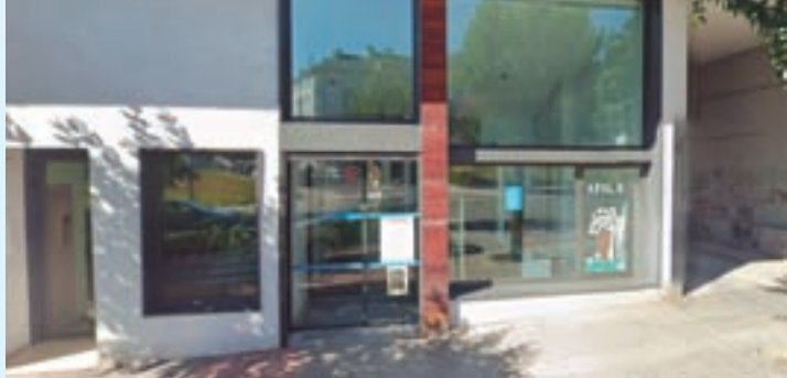
Centro de día de Alzhéimer de Lugo

Licitado o contrato para acometer melloras no illamento do Centro de Día de Alzhéimer de Lugo, ás que destina un orzamento de 100.000 euros. A intervención permitirá reducir o risco de aparición de humidades e condensación e incrementar o confort e benestar das persoas usuarias e persoal traballador do centro.