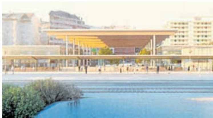
O proxecto da nova estación de tren

Pese a que resultaba notorio que a similar catalogación dos dous inmobles obedecía a un erro, xa que entre o da Estación (anterior a 1893) e o de Correos (posterior a 1977) dista case un século, a Xunta mudou de opinión opoñéndose a acelerar a súa corrección pola vía interpretativa, inicialmente acordada, e impedindo que a emenda se alcanzara coa aprobación dun informe de interpretación de interese público.