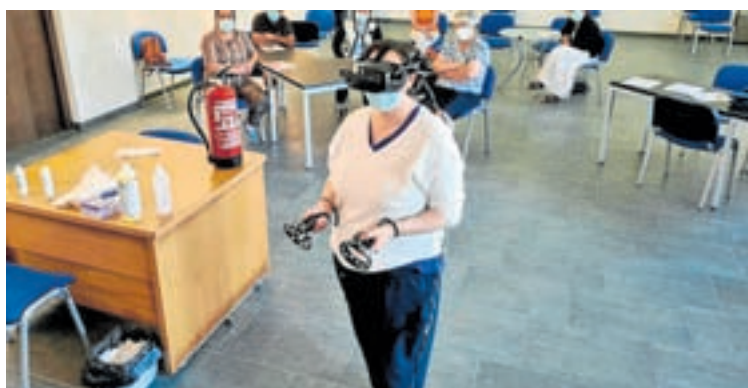
Instalacións de Estudios Rafer e un momento dunha formación

a actividade e cando a retomamos fixémoslo de maneira virtual. Iso mantívose ata agora e, na actualidade, a formación que ofrecemos é online vía streaming, o docente e os alumnos conéctanse á mesma hora para recibir a clase. Contamos tamén con sesións presenciais para complementar o proceso. Isto agrada os alumnos xa que aforran os desprazamentos, permite compaxinar mellor a vida persoal e familiar.