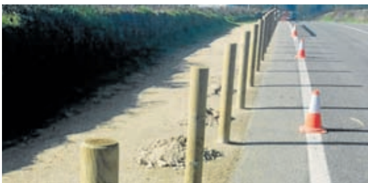
Actuacións en Gonzar

Estanse a realizar traballos de reforzo da seguridade viaria na estrada LU-633 ao seu paso por Gonzar, no concello de Portomarín, no treito coincidente co Camiño Francés, co fin de favorecer o tránsito seguro dos peregrinos. Os traballos que está a levar a cabo a Xunta consisten na instalación dunha varanda que separa a senda existente da vía autonómica, no punto quilométrico 70+790. Co obxectivo de reforzar a seguridade no cruce do Camiño Francés coa estrada LU-633, mediante a colocación dunha varanda peonil. Tamén se mellorará o firme neste