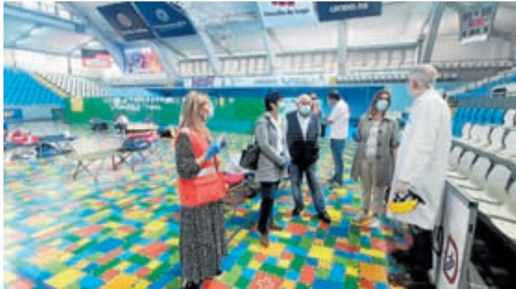
Hospital provisional no Municipal de Lugo na pandemia para os sen teito

O SAF ten por obxecto prestar atención ás persoas ou familias no seu domicilio, desde unha perspectiva integral e normalizadora, para facilitar o seu desenvolvemento persoal e a permanencia no seu medio habitual, especialmente naquelas situacións en que teñan limitada a súa autonomía ou noutras situacións de risco social para as cales resulte un recurso idóneo. Así, entre as súas funcións está o permitir a mellora a calidade de vida das persoas usuarias, favorecer e potenciar a autonomía persoal no propio domicilio, manter, mellorar e recuperar as redes de