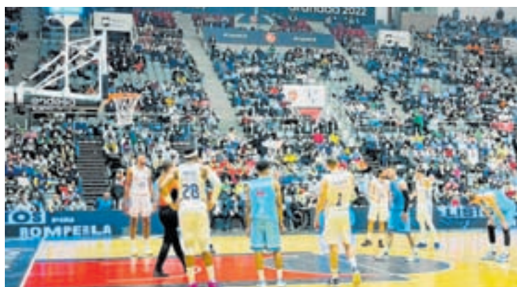
Imaxes do partido da Copa de Rei contra o Real Madrid