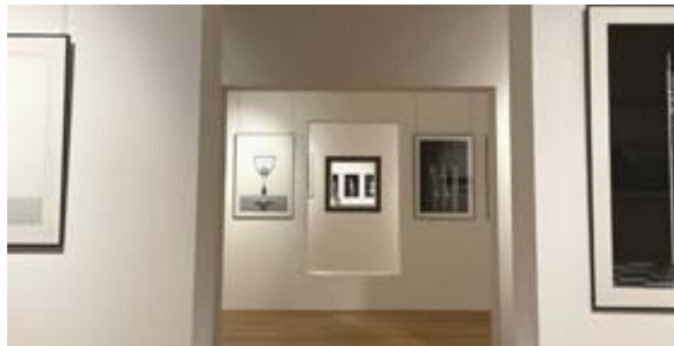
A sala de exposicións do Vello Cárcere

creación literaria e gráfica galega puido expresarse moderna e mostrar orgullosa ao mundo o seu potencial. Sen o traballo de Casal dificilmente coñeceríamos moitas das obras de Wenceslao Fernández Flórez, Otero Pedrayo, Blanco Amor, Ramón Cabanillas, Castelao, Carvalho Calero, Ramón e Antón Vilar Ponte, Vicente Risco, Maside ou Seoane entre outros moitos.