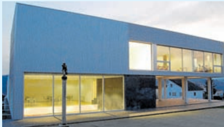
Casa da cultura de Guntín

Desta forma estase a universalizar a cultura, fomentar que poida ser accesible para todos e tamén garantir que o rural teña as mesmas posibilidades. En total, o proxecto contou cun investimento de máis de 36.000 euros. O centro conta con salón de ac-