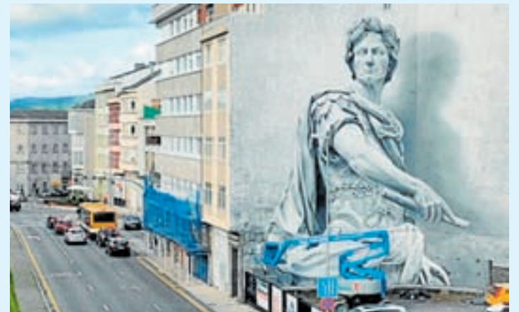
O mural de Caio Julio César, de Diego As

O grafiti de Diego As Cayo Julio César cativou ao mundo enteiro e fíxose co primeiro posto do The Best of 2021 Street Art Cities que é unha plataforma global cuxa misión é promover e documentar o arte urbano no mundo. Están activos en case 900 cidades con máis de 37.000 obras de arte. Durante o último ano, fóronse compartindo os murais e traballos acadando como resultado unha selección das 100 obras de arte máis populares do 2021. Esta lista global conta con rincóns de todo o planeta, dende Dinamarca ata Sudáfrica.