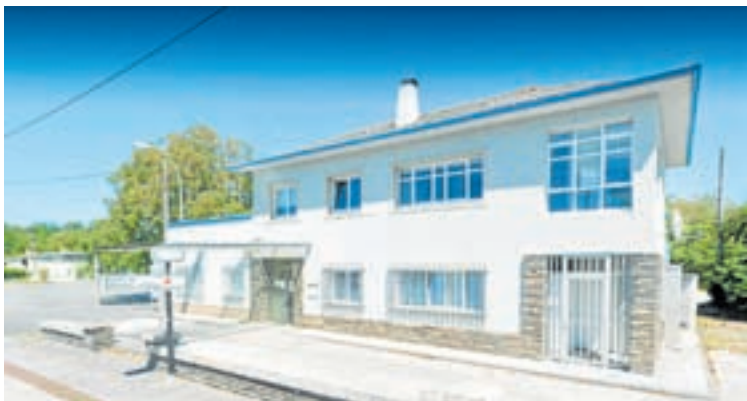
Centro de saúde de Outeiro de Rei