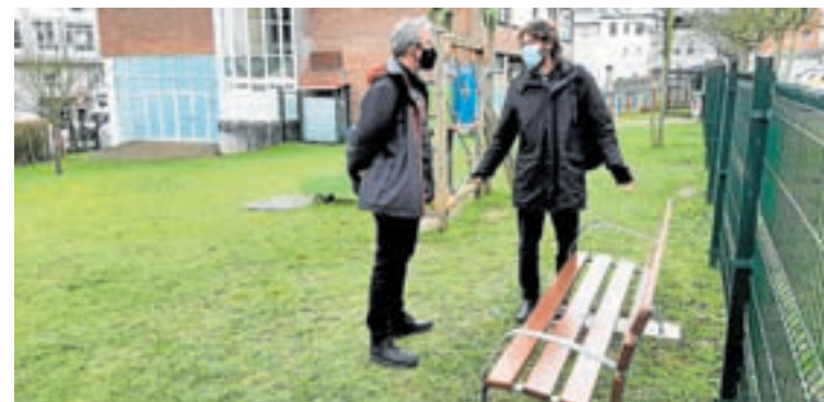
Visita ás instalacións do CEIP Casás

A concellería de Infraestruturas Urbanas vén de instalar novos aparcabiscis e bancos no colexio de Casás, respondendo a unha solicitude da comunidade educativa trasladada pola concellería de Educación.