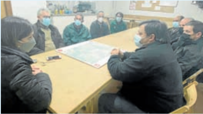
Reunión cos veciños da parroquia

Os veciños de Santa Cristina de San Román recibiron o proxecto de mellora de dous importantes accesos viarios municipais nesta parroquia, obra na que se investirán 115.000 euros.