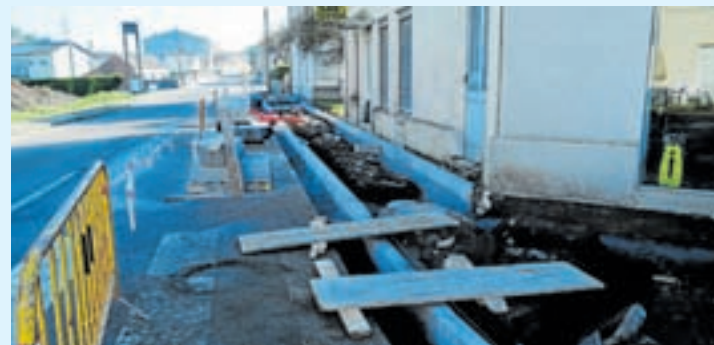
Obras das beirarrúas en Castro de Rei

A Xunta adxudicou por preto de 375.000 euros as obras de renovación integral de beirarrúas en Castro Ribeiras de Lea.