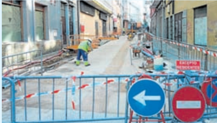
Imaxe de arquivo das obras en Recatelo

Seguen avanzando os traballos de peonalización no barrio de Recatelo. Comezaon polas rúas Avelino Pousa Antelo e Isaac Díaz Pardo.