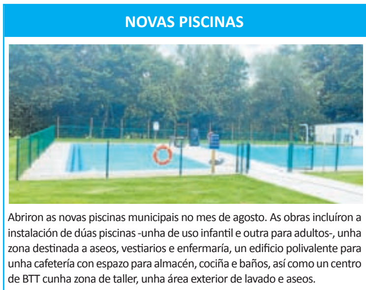
NOVAS PISCINAS Abriron as novas piscinas municipais no mes de agosto. As obras incluíron a instalación de dúas piscinas -unha de uso infantil e outra para adultos-, unha zona destinada a aseos, vestiarios e enfermaría, un edificio polivalente para unha cafetería con espazo para almacén, cociña e baños, así como un centro de BTT cunha zona de taller, unha área exterior de lavado e aseos.

Seguirase apostando pola inversión en novas infraestruturas públicas que melloren a calidade de vida dos cidadáns e tamén supoñan crecemento económico, así como novos postos de traballo. O orzamento aprobouse con 9 votos a favor e 3 en contra.